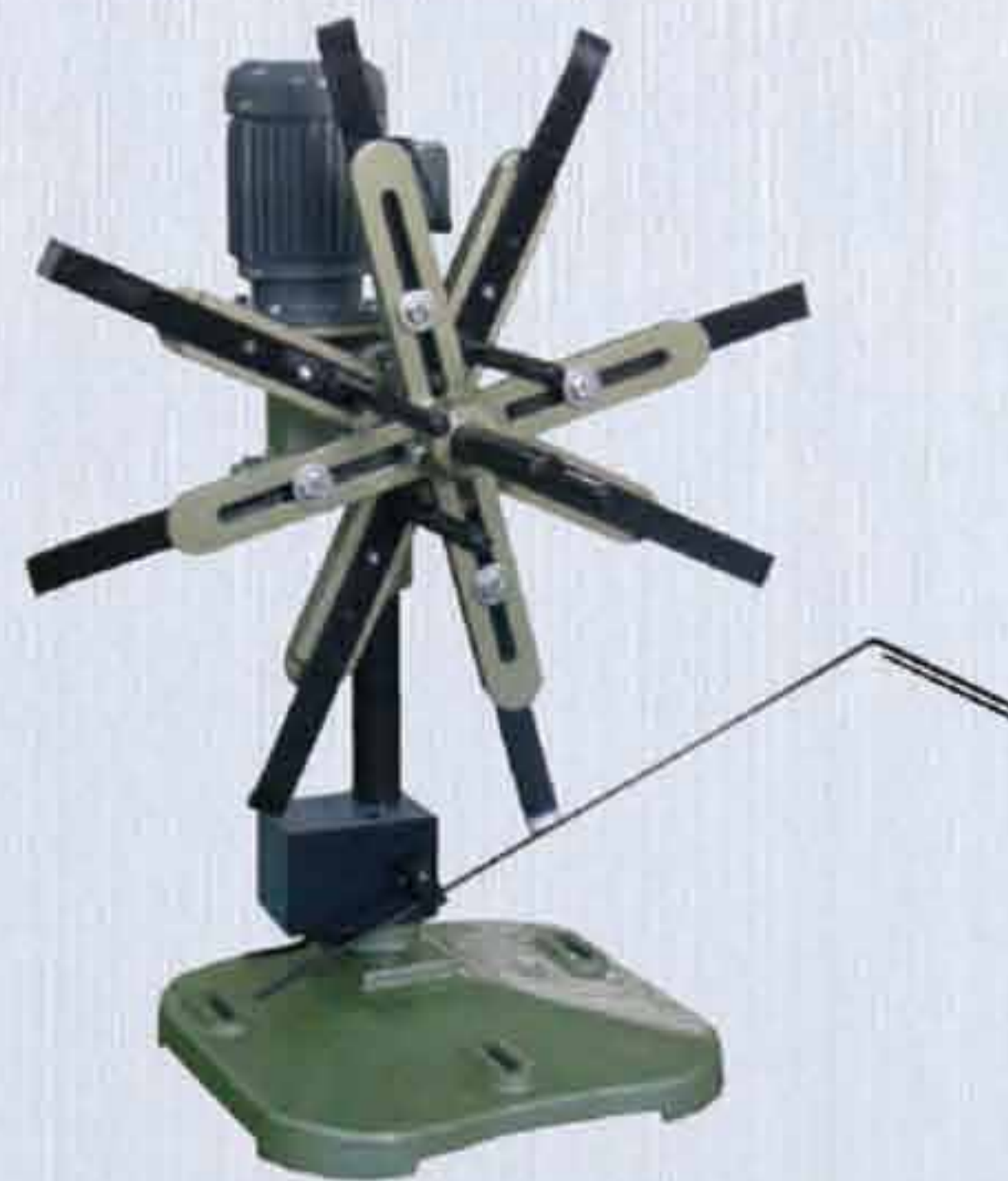
CR型 微動式 CR LIMIT SWITCH CONTROL TYPE