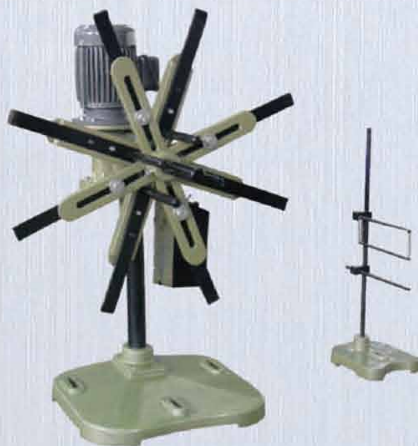
CR型 感應式 CR TOUCH SENSOR CONTROL TYPE